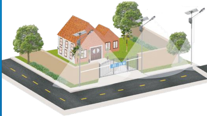
ISCT LED ALLEGRA 70W 20-25 Mts.