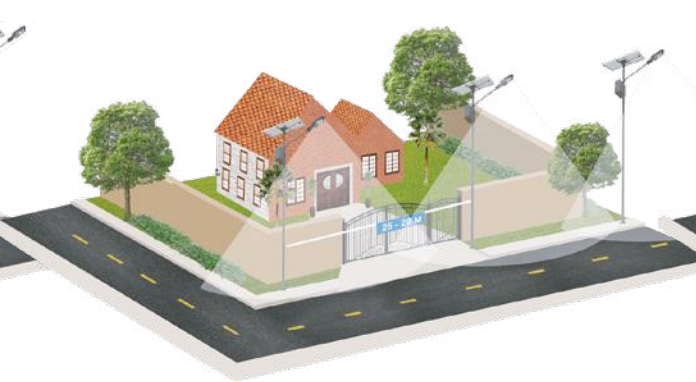
ISCT LED ALLEGRA 90W 25-28 Mts.